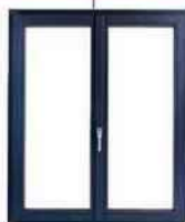
PVC. Clair de jour amélioré, double vitrage. « Pixel », Oknoplast, 595 € TTC (140 x 130 cm).