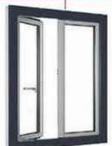
PVC. Ouvrants renforcés de fibre de verre. « Maestria », Lo-renove, 920 € HT (185 x 140 cm).