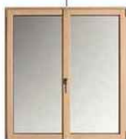
Mixte. Alu, PVC et bois. Double vitrage. « !So », Sola-baie, 800 € TTC pose incluse.