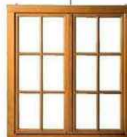
Bois. En lamellé-collé, 5 essences, 11 teintes. « TB67 », Tryba, prix sur demande.